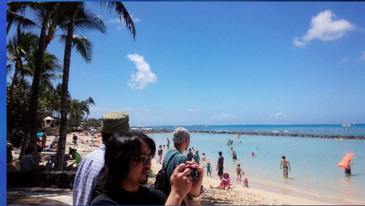
2年に1回の海外旅行