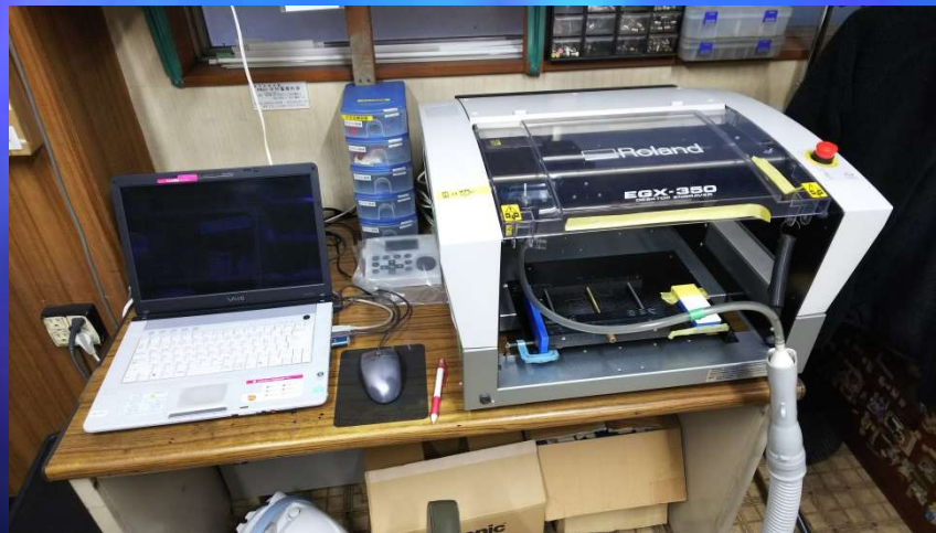
制御盤等銘板製作マシン